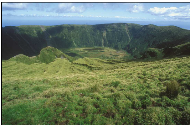
Foto 3. Caldeira do Faial