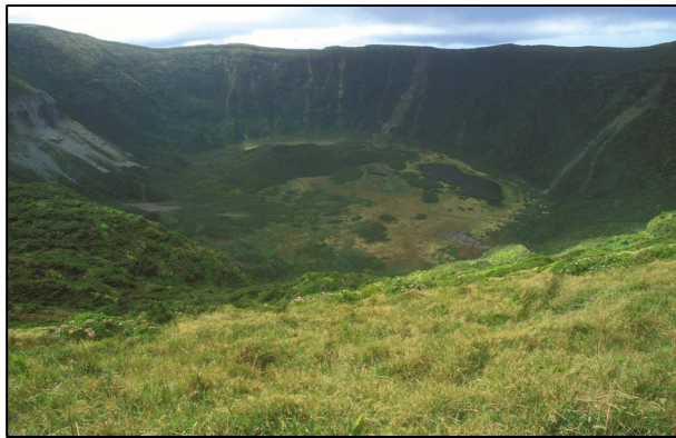
Foto 2. Caldeira do Faial

(Fuente: http://www.pbase.com/photokhan/image/50801371 )