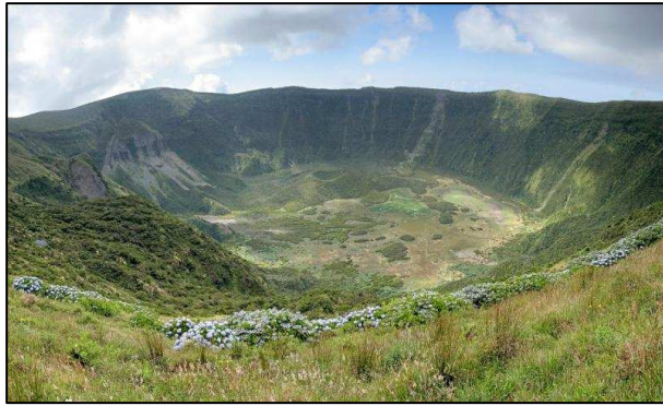
Foto 1. Caldeira do Faial

(Fuente: http://www.pbase.com/photokhan/image/50801371 )