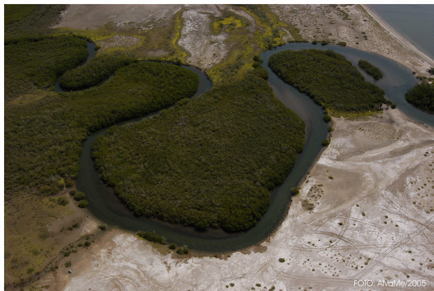
Estero Zacatecas Detalle