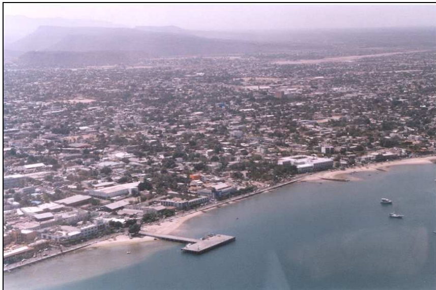
Desarrollo Urbano en La Ensenada de La Paz