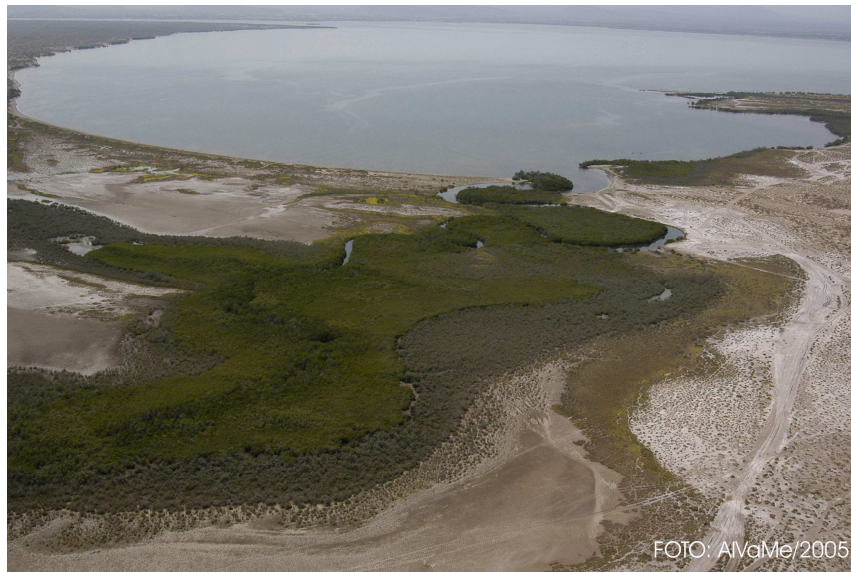
Estero Zacatecas General