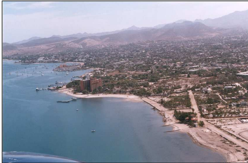
Ensenada de La Paz