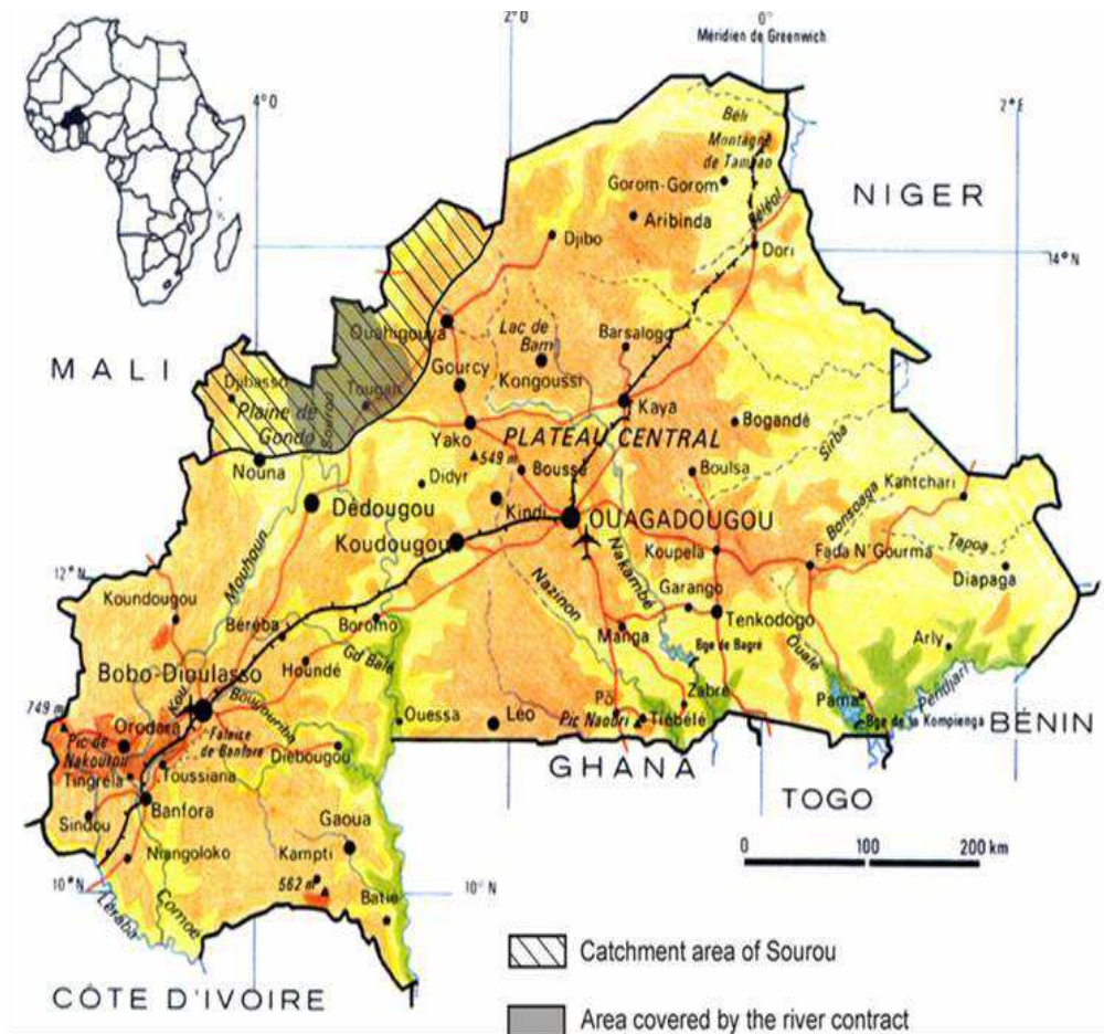
Figure 1 : Zone couverte par le Contrat de Rivière au Sourou, Burkina Faso.

d'hivernage (1260 UFC/100 ml pour Escherichia coli et 5000 UFC/100 ml pour les coliformes fécaux) et en saison sèche (393 UFC/100 ml et 1000 UFC/100 ml respectivement pour ces deux paramètres) (Tableau 6). L'analyse de variance indique toutefois que les résultats observés ne sont pas liés à la période d'échantillonnage ( p < 0,05 ; Tableau 5). Par contre, le point de contrôle (site) influence grandement les résultats observés ( p < 0,01 ; Tableau 5).