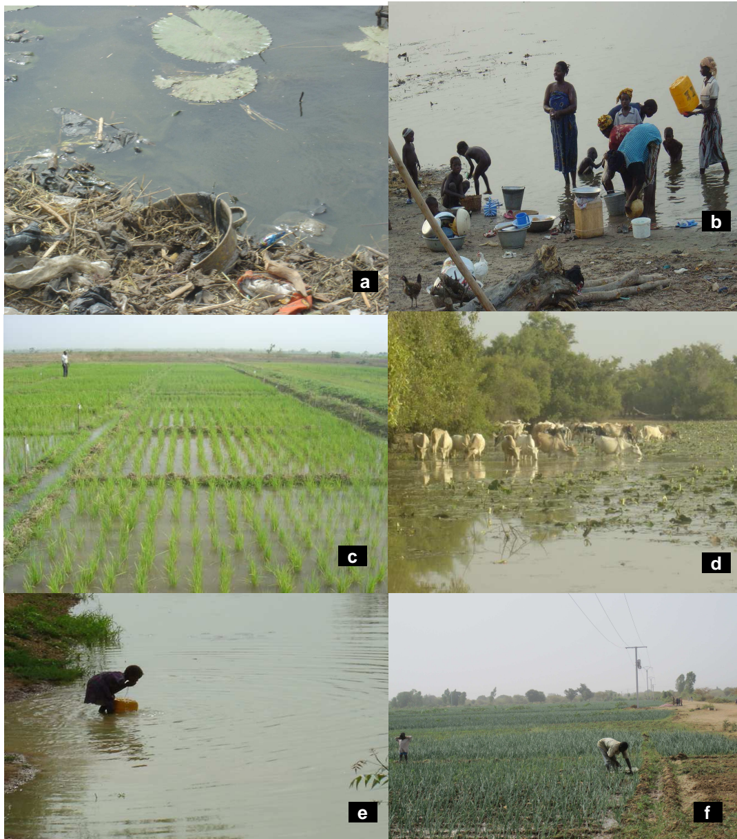
Figure 3 : Quelques principaux usages et fonctions des eaux de surface au niveau des points de contrôle dans la vallée du Sourou en période de forte demande. (a) déjection d'ordures et d'eaux usées à Toma-île aval ; (b) activités ménagères et récréatives à Toma-île amont ; (c) riziculture sur les berges à Débé aval; (d) abreuvement d'animaux au point de contrôle du Gana en fin de saison pluvieuse ; (e) approvisionnement en eau de boisson à tous les points de contrôle ; (f) cultures maraîchères particulièrement à Débé aval et Di aval.