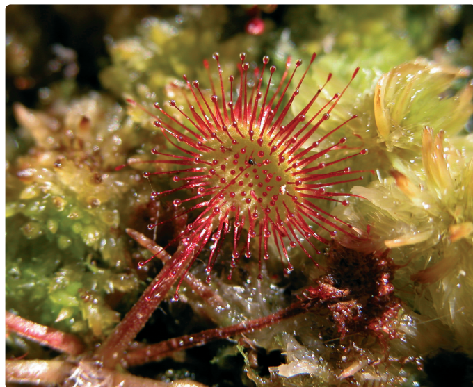
Rundsilshår är en insektsätande växt. Insekterna fastnar på de klibbiga spröten och bryts sedan ner av växten.

Intill den gamla järnvägsbanken som trafikerade Ulricehamn-Jönköping, vid Jäboån, ligger Britas källa som ansågs skänka livslång hälsa om man offrade några mynt i källans djup. I området finns också kolbottnar och rester från järnframställning.