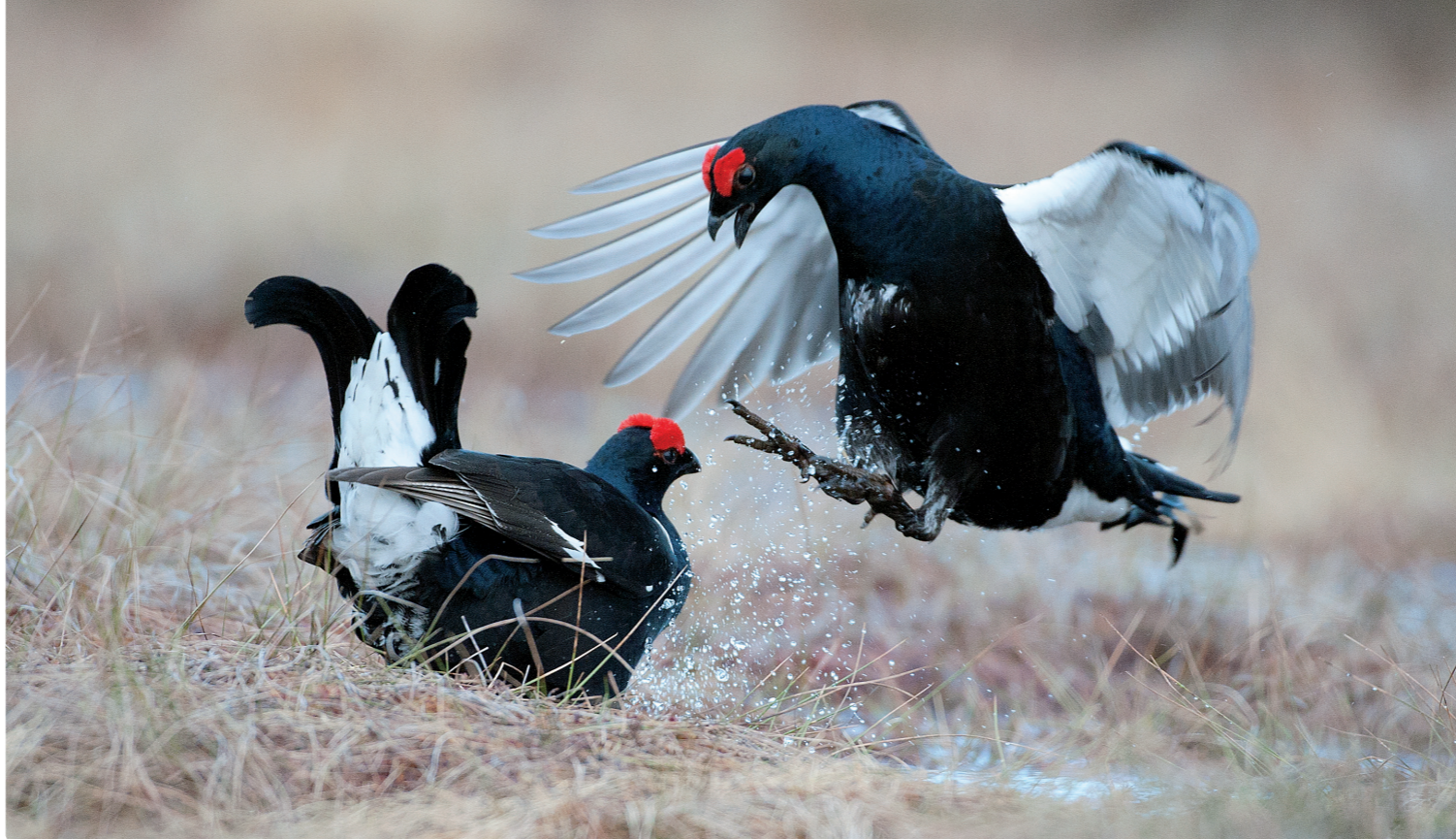
Under tidiga vårmorgnar samlas orrtuppar på mossens öppna ytor och spelar medan hönorna tittar på.